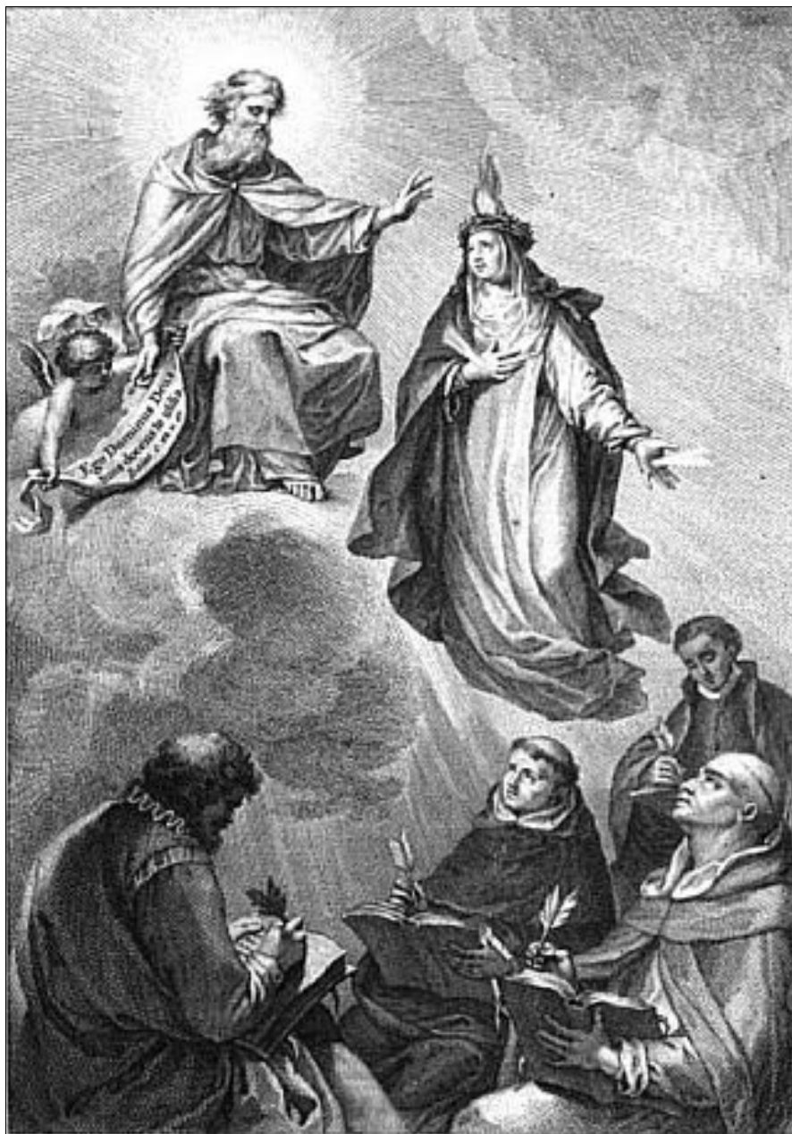
Svatá Kateřina Sienská OP – Dialog s Boží Prozřetelností